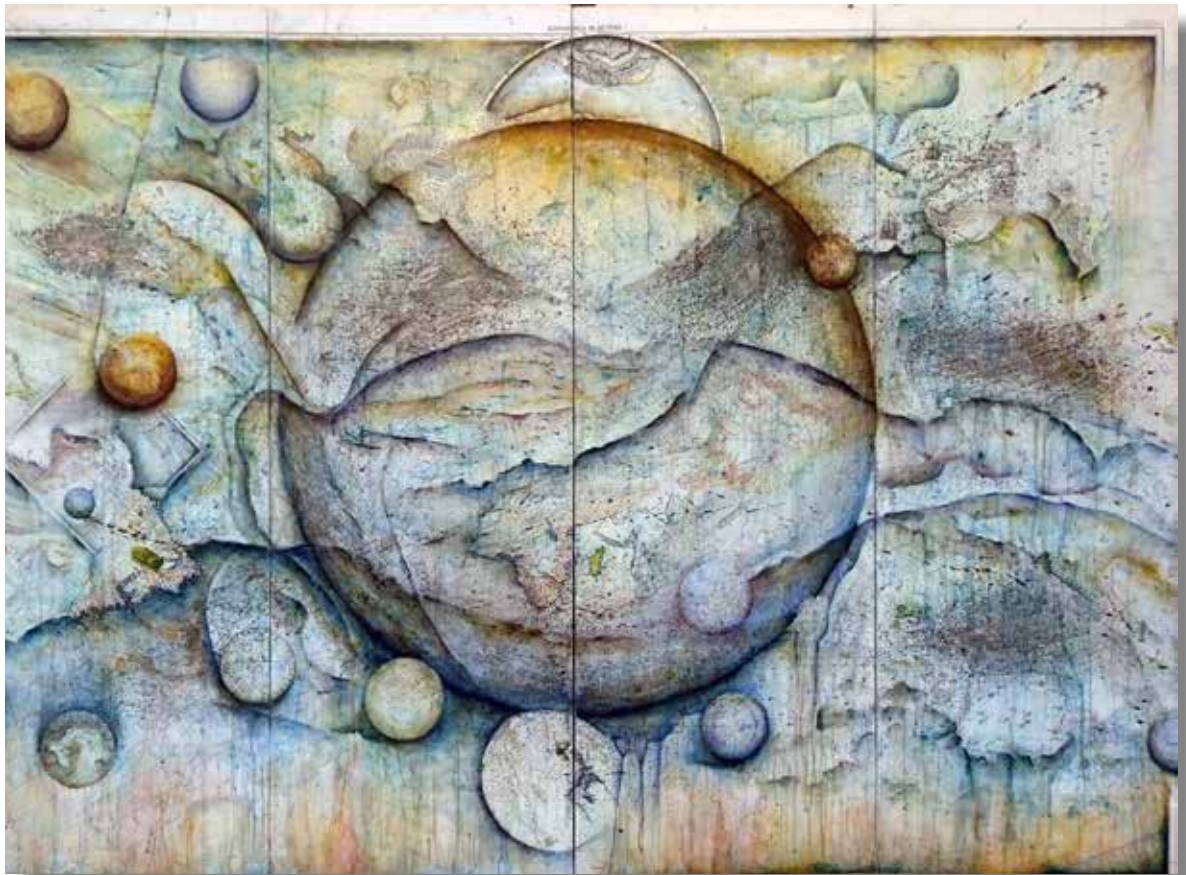
En tout temps, en tout lieu - 2013 - Acrylique sur cartes marouflées sur toile 150 cm x 200 cm