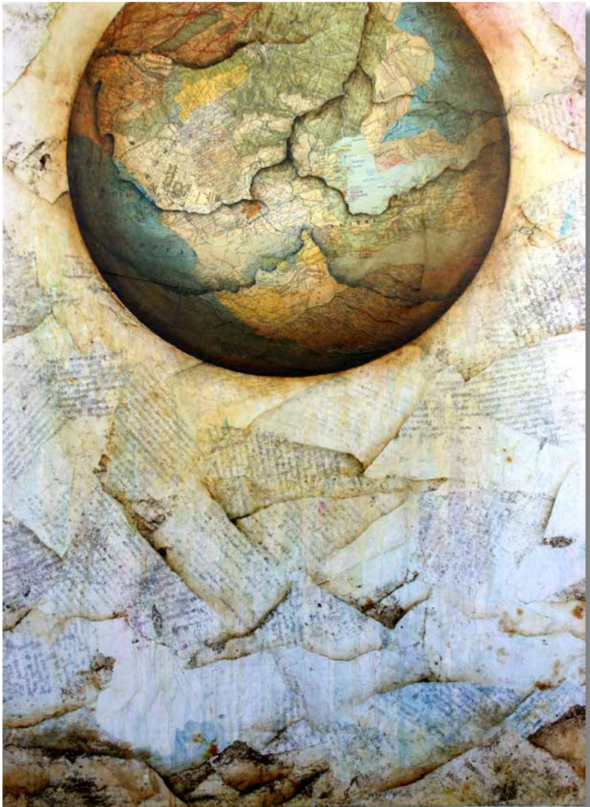
Schisma - 2001 - Acrylique sur papiers marouffés sur toile 100 cm x 73 cm