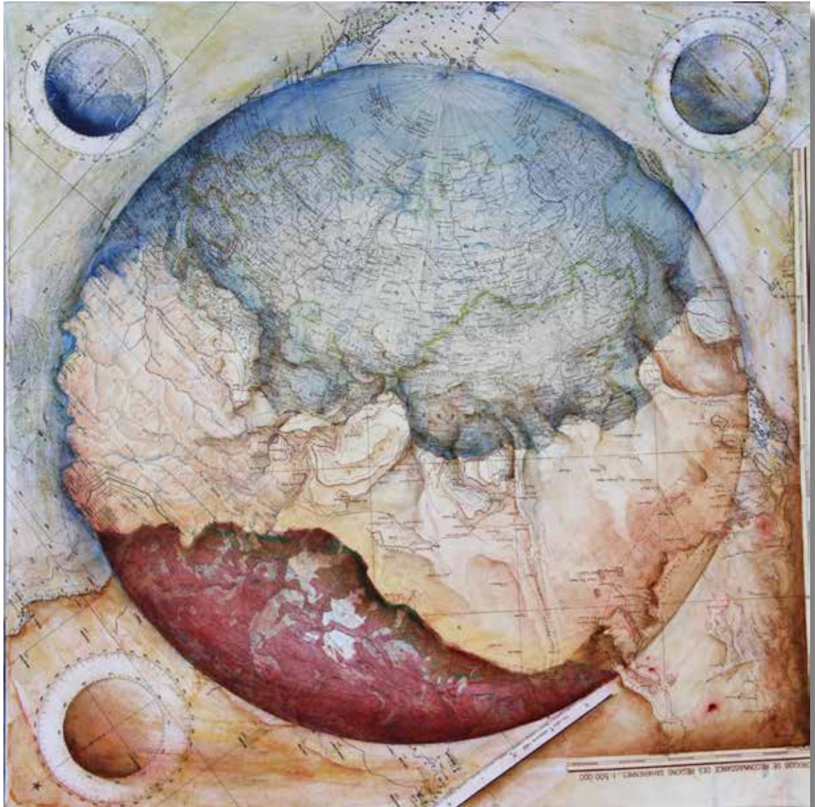
Croquis de reconnaissance - 2021 - Acrylique sur cartes marouflées sur toile 60 cm x 60 cm

Sous l'œil et la main de l'artiste le plan redevient sphère, la culture redevient nature, le savoir des paysages redevient paysage du savoir, et nous redevons explorateurs de nos territoires anciens métamorphosés.