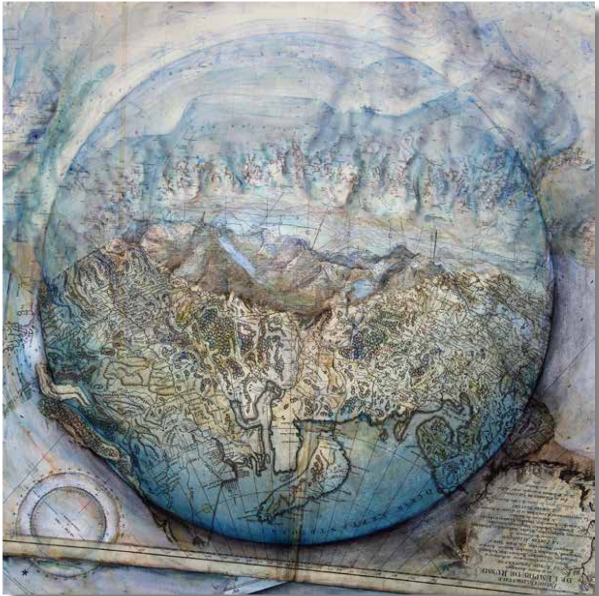
Nord/Sud - 2021 - Acrylique sur cartes marouflées sur toile 60 cm x 60 cm