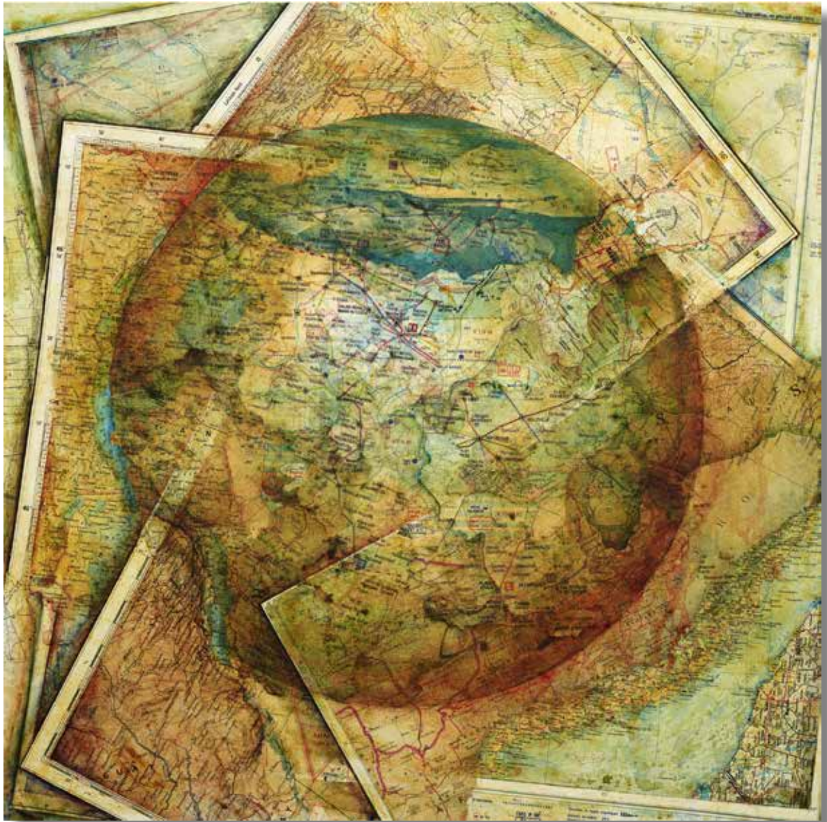
Radionavigation- 2017 - Acrylique sur cartes marouflées sur toile 50 cm x 50 cm

Des lignes, des routes, des cartes de tous les continents, à toutes les échelles pour toutes les distances et tous les voyages dans les airs, sur l'eau, sur terre, sous terre se superposent (Carte de radionavigation aérienne IGN ; Plan Métro parisien RATP ; The North American, Road atlas Gousha/Chek-chart ; Carte Allemagne de l'Ouest Amt für Militärisches Geowesen DMG...).