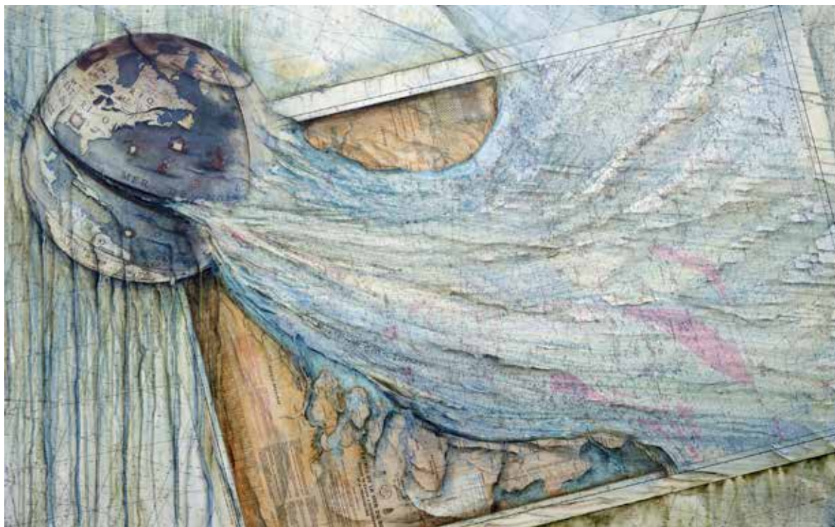
Entrée de la Mer de Nort - 2009 - Acrylique sur cartes et tirages marouflés sur toile 97 cm x 146 cm

D'une série qui nous parle de traversées, de voyages et de découvertes, les cartes marines ont été collectées au retour des marins. Elles se fondent ou dialoguent avec des figurations plus anciennes.