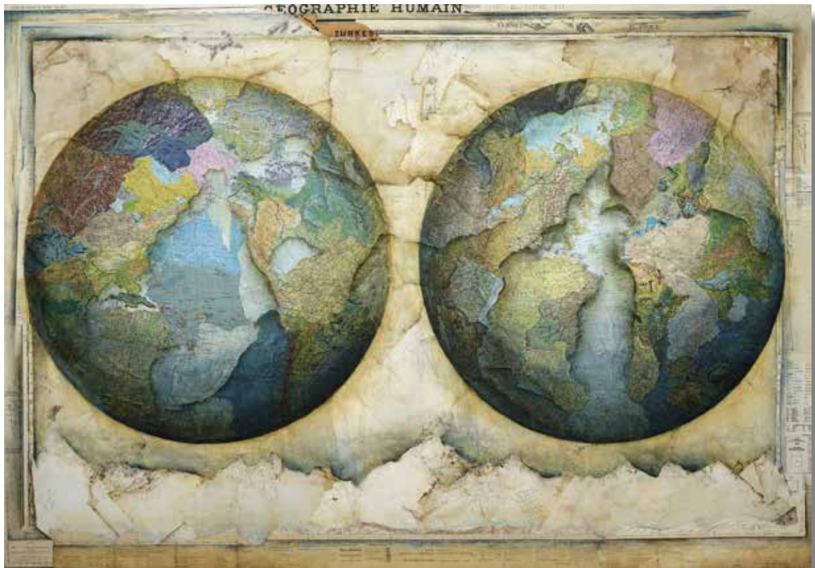
'GEOGRAPHIE HUMAIN' - 2002 - Acrylique sur cartes marouflées sur toile 114 cm x 162 cm

Il s'agit de paysages, mais le paysage n'est plus seulement ce que le peintre embrasse du regard, il est devenu planétaire, et les cartes sont à refaire. Les figures de la terre sont ici celles de l'espace vécu, fait de proche et de lointain, de liens et de fractures, de souvenir et d'oubli, de local et de global. Celles que chacun porte en lui, terres mentales, vécues ou imaginaires, faites de fragments, qui invitent à des parcours lents et fouillés ou à des survols rapides.