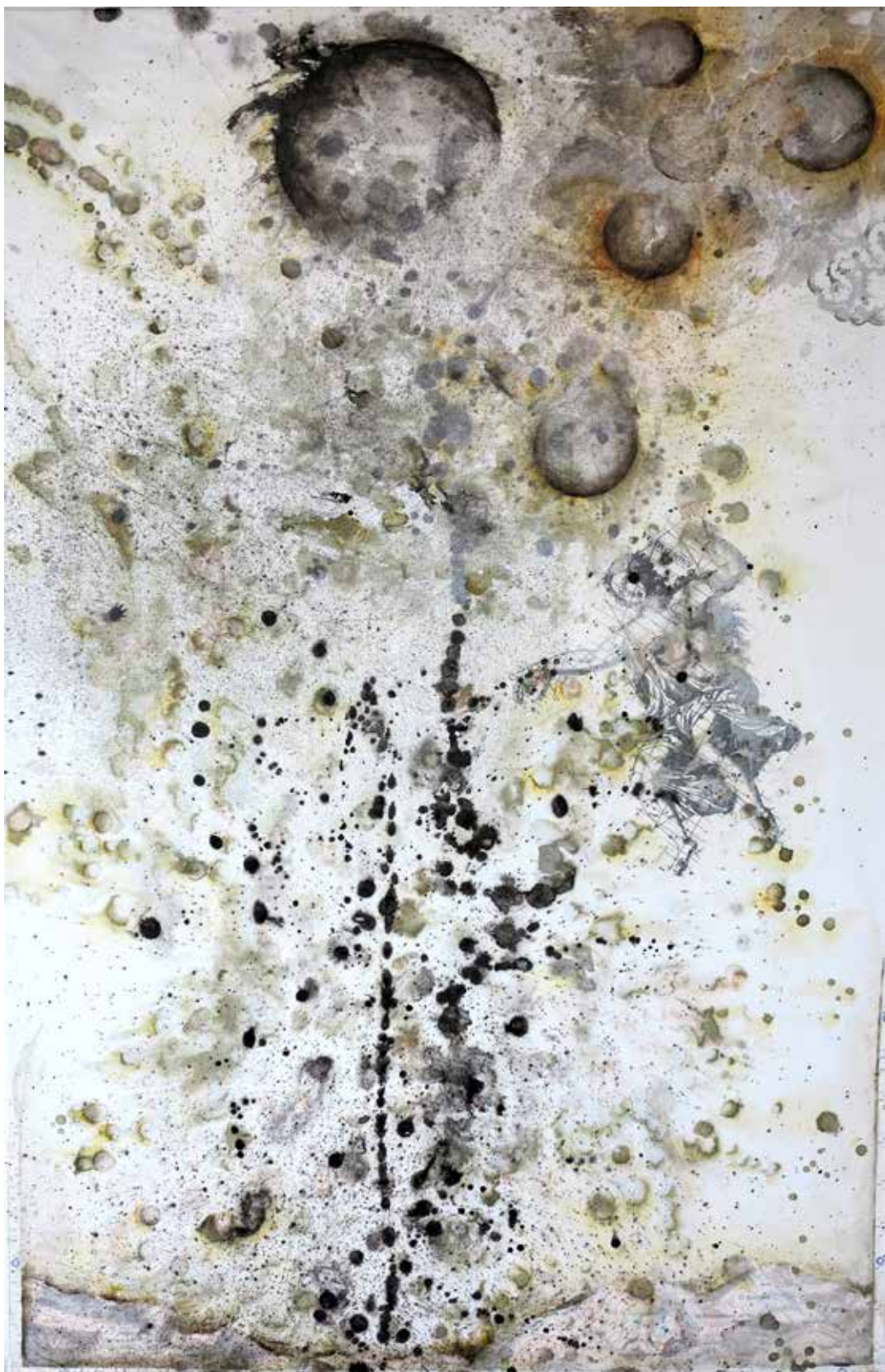
GE0313 - 2014 - Acrylique sur papiers marouflés sur toile 130 cm x 81 cm

Convoquer le hasard dans un travail tout d'abord gestuel et très humide. Continuer une aventure qui ne nous mène pas du tout là où l'on voudrait. Ce hasard, cet incertain, rêver de le dominer, de l'organiser.