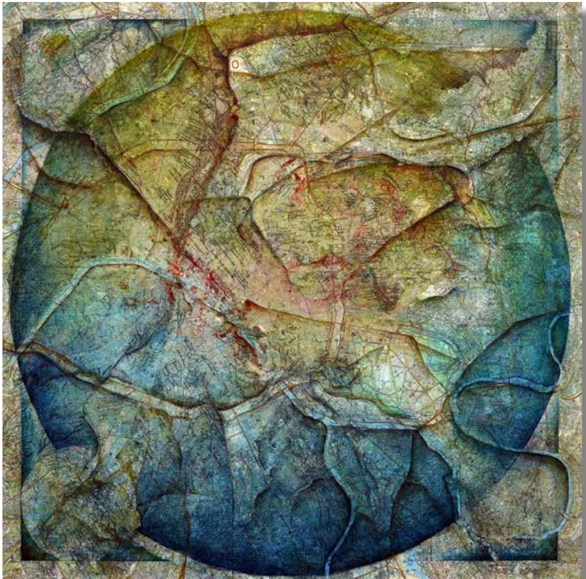
Top 25 - 2314OT - Paris - 2019- Acrylique sur carte IGN marouflée sur toile 80 cm x 80 cm