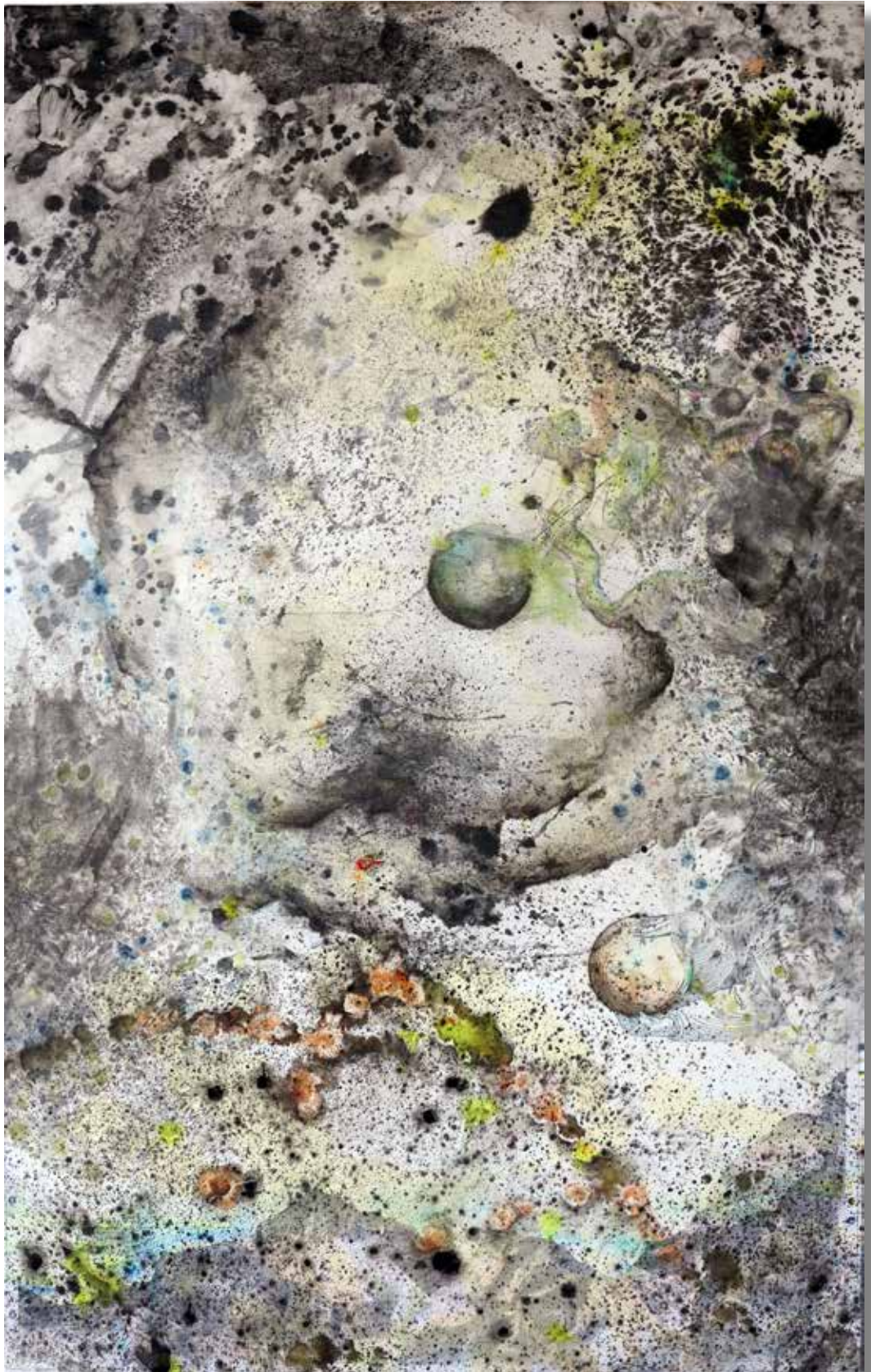
GE0313 - 2014 - Acrylique sur papiers marouflés sur toile 130 cm x 81 cm

Dans l'univers encore largement non cartographié, chaque jour, nous nous découvrons ,de plus en plus petits, grains de poussière d'étoiles dans l'univers. Astres et désastres dans le ciel, souvent invisibles.