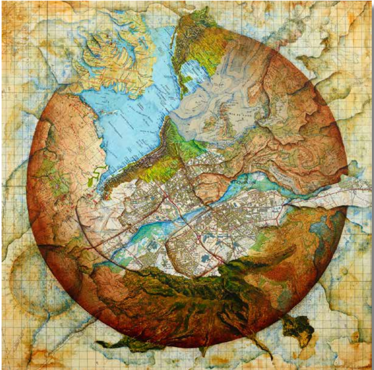
De la place de l'Hôtel de ville - 2015 - Acrylique sur cartes marouflées sur toile 50 cm x50 cm

Au centre, le centre-ville, la place de l'Hôtel de ville Autour, plus ou moins proche, à différentes échelles, ce qui compte dans le reste du monde. En bas, à mi-chemin entre carte et paysage, une image spot. En fond, carte de navigation aérienne.