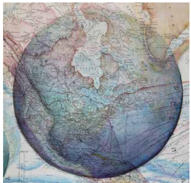
Une seule carte ici, Planisphère présentant l'ensemble des communications[...] Paris 1898

Sous l'œil et la main de l'artiste le plan redevient sphère, la culture redevient nature, le savoir des paysages redevient paysage du savoir, et nous redevenons explorateurs de nos territoires anciens métamorphosés.