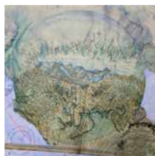
Le début de la peinture